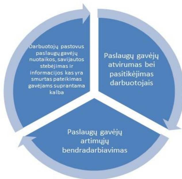
Schema Nr.1. Smurto ir finansinio piktnaudžiavimo prevencija